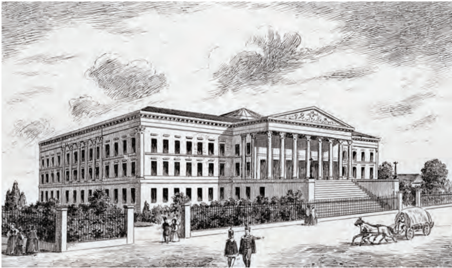
Le Musée national de Hongrie en 1846 (à l'époque, le Musée national comprend également la Bibliothèque nationale comme l'un de ses départements).