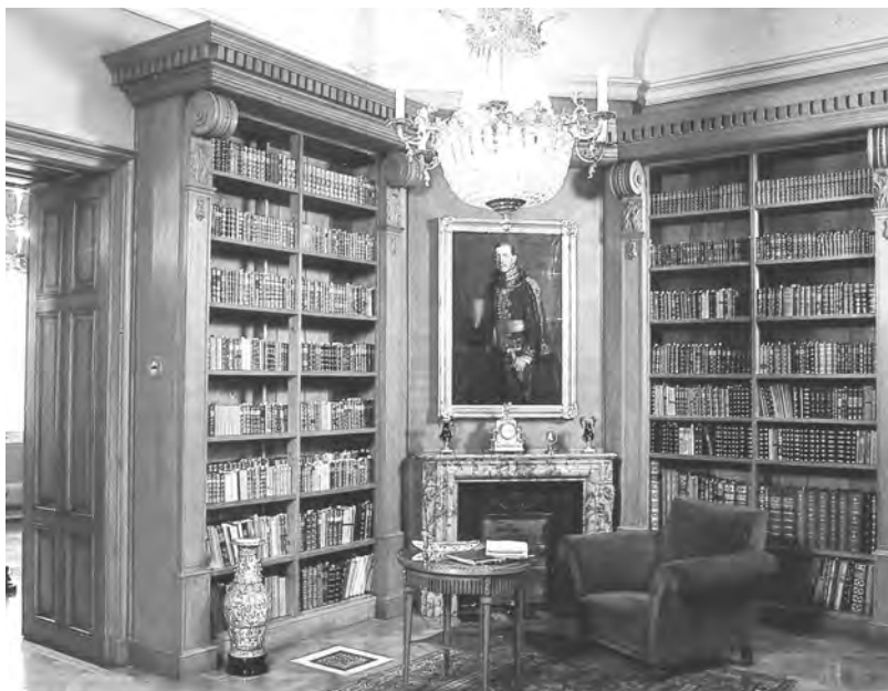
Vue de la bibliothèque de Keszthely.