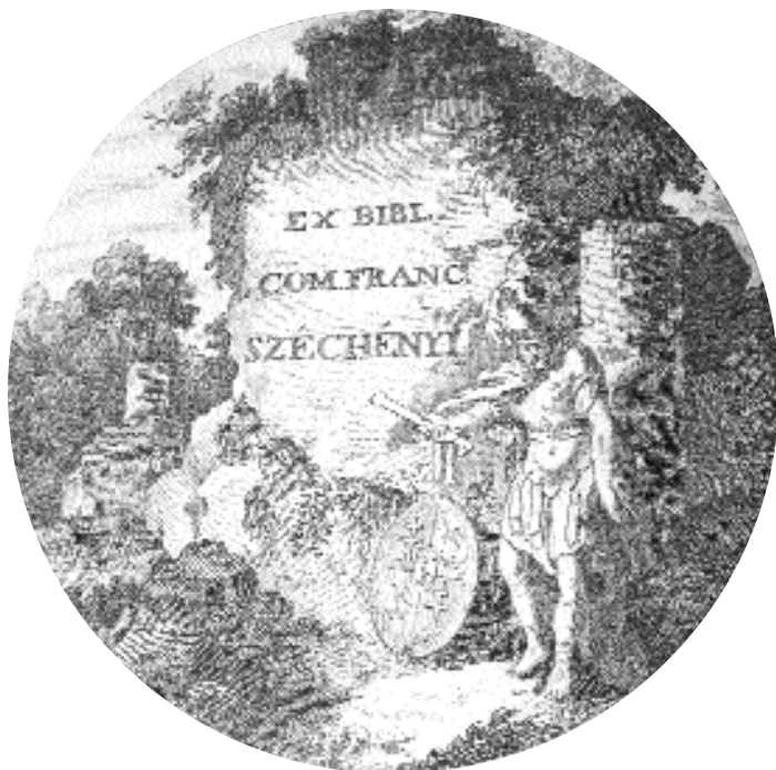
Ex libris du comte Széchényi, Pest, 1874.